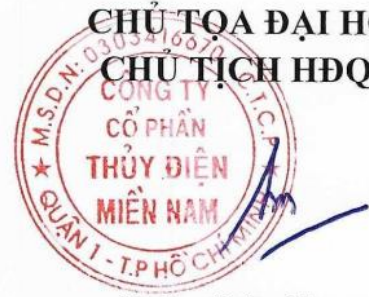
Đoàn Đức Hưng